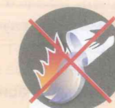
Оставлять костер непотушенным

поведения при лесном пожаре ПАМЯТКА по правилам