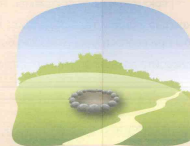
Очистите место от сухой травы и листьев, (зимой – от снега), обложите камнями