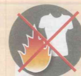
Приближаться в синтетической одежде