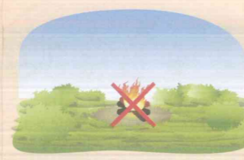
На торфяном болоте