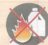
Лить в костер горючие жидкости