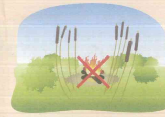
В зарослях сухого камыша