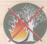
Поджигать сухое стоящее дерево