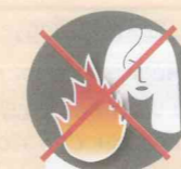
Находиться у костра с распущенными волосами