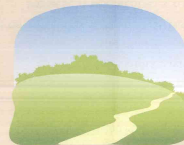
Найдите поляну, защищенную от ветра

ПОМНИТЕ! Любой лесной пожар начинается с маленького очага.